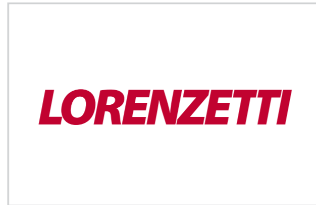
Formica liso branco Vinil adesivo vermelho