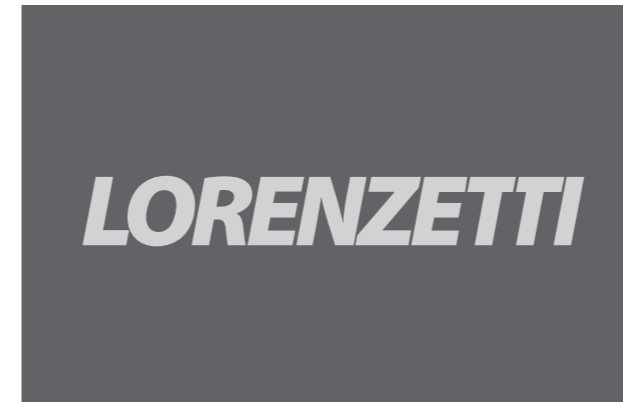
Formica liso cinza escuro Vinil adesivo cinza claro