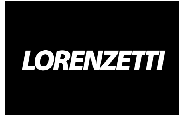
Formica liso preto Vinil adesivo branco