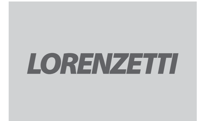
Formica liso cinza claro Vinil adesivo cinza escuro