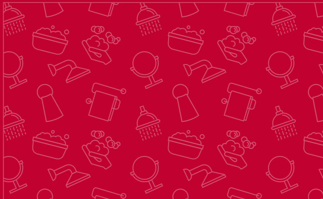
Banheiro (Metais, Plásticos, Chuveiros Elétricos)