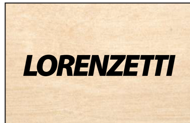
Formica madeira (ex. marfim) Vinil adesivo preto